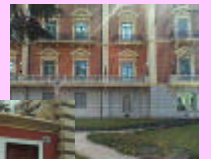
美術館にも行きました!