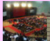
ライブも行ったし

レッスン風景をお見せできないのが残念ですが、毎日6時間くらいフラメンコ漬けでした。 この激しい疲労と爽快感は、心地よいですね。