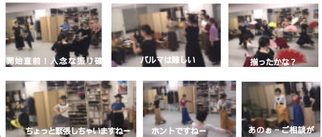
開始直前!人念な振り幅