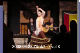
2008.04.23 アルハムブラ vol.8