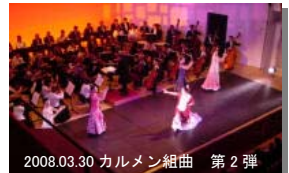
2008.03.30 カルメン組曲 第2弾