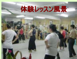
体験レッスン風景